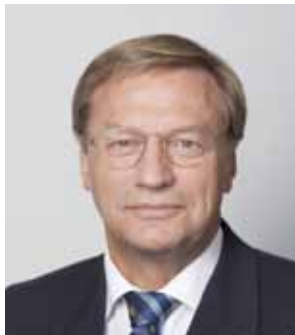
Wolfgang Bosbach Mitglied des Bundestags

Familiengeführt und hoch erfolgreich, operiert die Krüger GmbH seit vier Jahrzehnten aus Bergisch Gladbach. Heute ist das Unternehmen Marktführer im Segment der löslichen Kaffeespezialitäten. Eine solche Position erlangt man nicht ohne ein gerütteltes Maß an Kreativität, Innovationsfreude und Unternehmergeist.